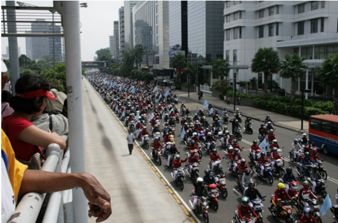
〈사진 2〉 2011년 국제노동절시위에 참여한 노동조합원들이 질서정연하게 오토바이 퍼레이드를 펼치며 대통령궁으로 향하고 있다. 노동조합들은 2010년에 이어 두 해 연속으로 메이데이 기념행진에 복지 개혁을 요구하는 대규모 노동자 동원을 대규모로 성사시켰다.

조직(OPSI: Organisasi Seluruh Pekerja Indonesia), 직물의류가죽업종근로조합개혁연맹(FSP TSK SPSI Reformasi) 등입니다. 이 노조들이 사회보장행동연대(Komite Aksi Jaminan Sosial, 이하 KAJS)를 주도적으로 결성하였습니다. 그리고 이 연대체가 사회보장 개혁을 요구하는 시위를 펼치며 사회보장관리공단법을 조속히 제정하도록 유도요노 정부와 의회를 압박하는 활동을 아주 적극적으로 전개했습니다. 4)