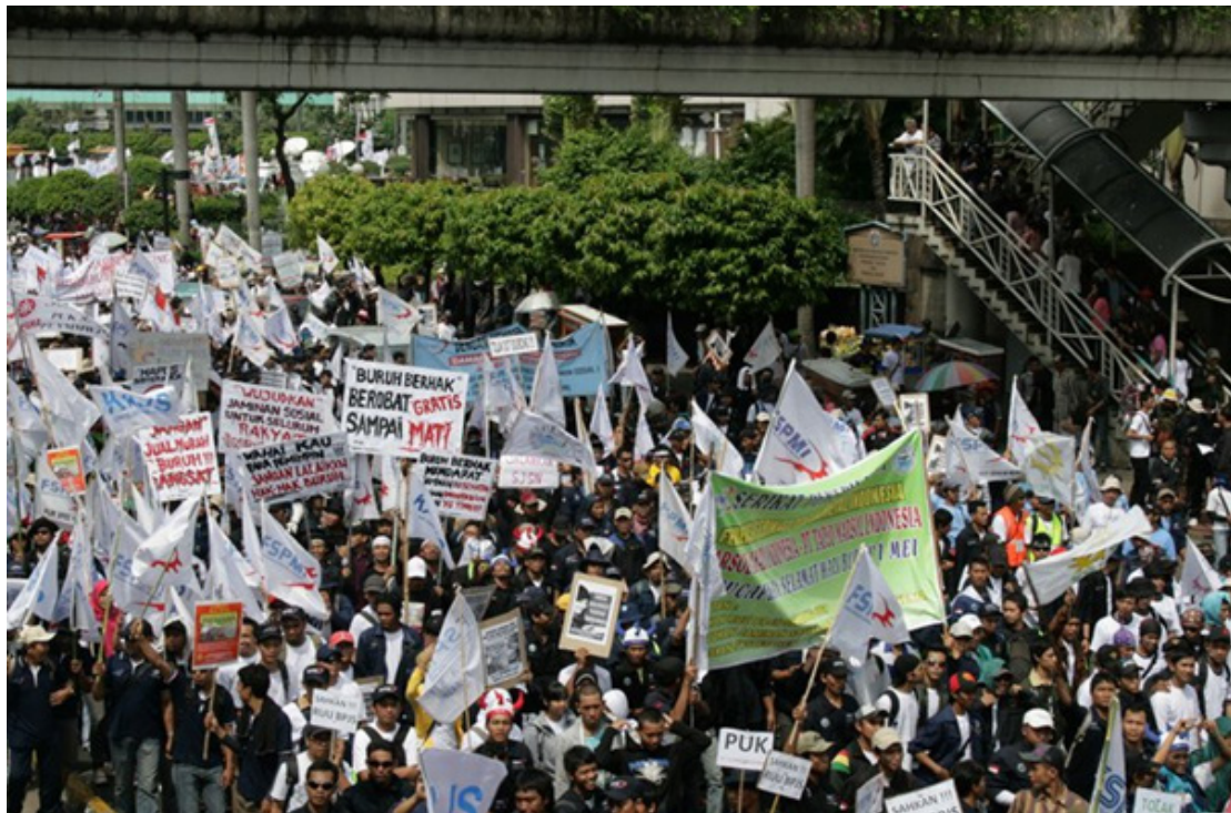
〈사진 3〉 2011년 자카르타의 국제노동절 시위에 참여한 노동자들이 대통령궁으로 행진한다. “노동자는 죽는날까지 무상의료를 받을 권리가 있다”는 플래카드도 보인다.

저의 해석은 사회학적이면서도 변증법적인 것으로서 BPJS 법이 그 초안을 지지하는 이들이나 거부하는 이들 어느 한 측의 요구로 100% 채워지지 않았다는 것입니다. 그러다보니 BPJS법에서 명시하지 않은 바들을 처리하기 위한 추가적인 시행령들을 필요로 하였고 새로운 사회보장 제도가 효과적이고 신속하게 구현되는데 장애를 유발하게 되었지요.